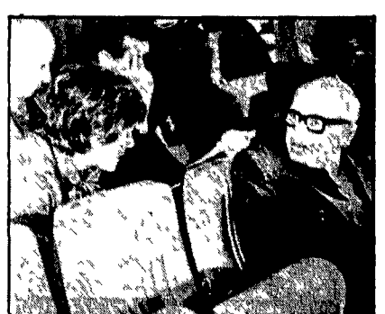
MOSCA — Scambio di battute tra Sakharov e Petra Kelly, leader del verdi tedeschi, durante i lavori del Forum

Così questo «forum» del tutto inedito si sta trasformando ora dopo ora in una manifestazione di sostegno non tanto o non soltanto alle proposte di Mikhail Gorbaciov in tema di disarmo nucleare, quanto alla linea del rinnovamento interno che egli propugna. E quelli che erano arrivati scettici scoprono che sì, per davvero si può discutere anche tra punti di vista diversi e perfino opposti e che lo scopo del «forum» non era quello di costringere tutti sui rigidi binari di una discussione predefinita. Anzi, la squadra sovietica (l'unica squadra perché gli altri sono arrivati da tutti in ordine sparso) è comparsa solo attorno al tavolo dove si discute tra scienziati, di misure concrete, tecniche di disarmo, di Sdi, di esperimenti nucleari.